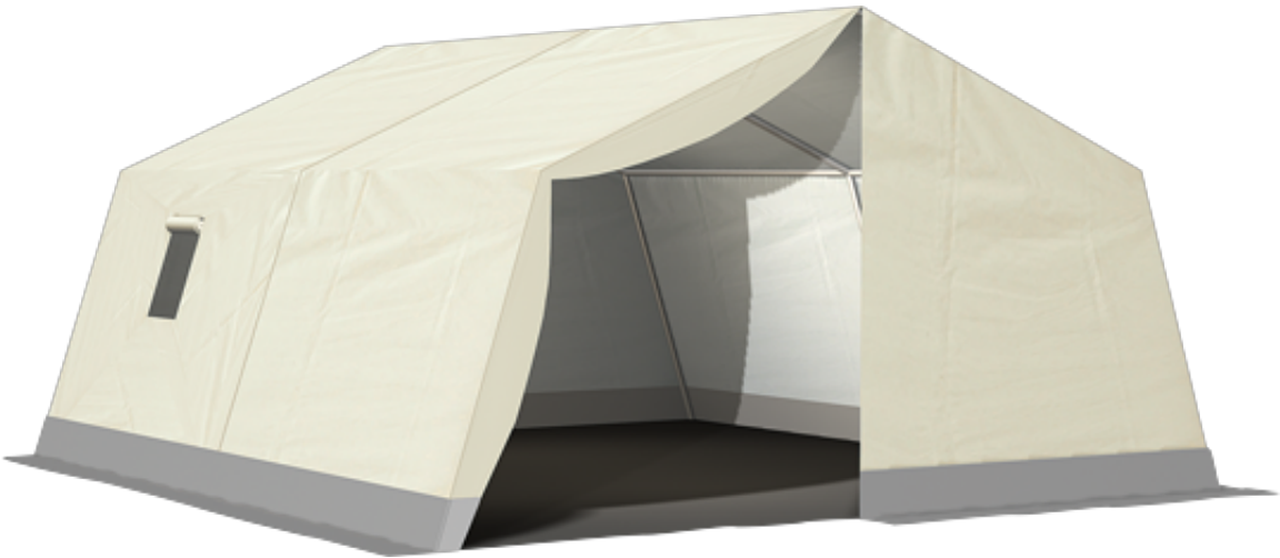
篷房俯视图与侧视图