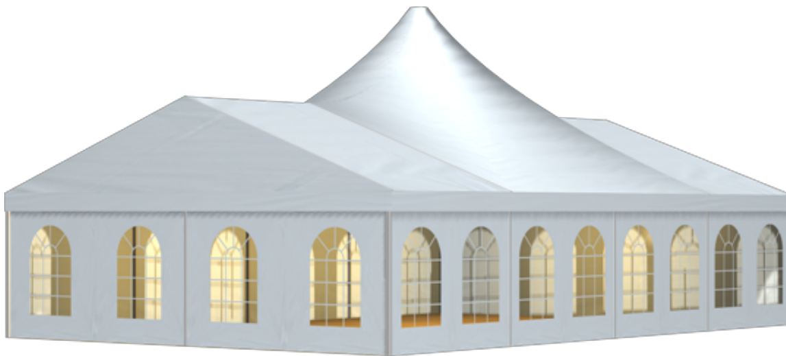
篷房俯视图与侧视图