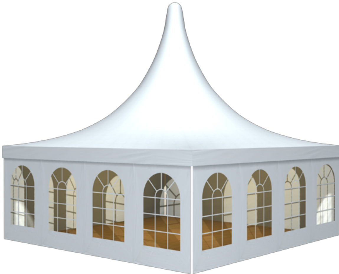
篷房俯视图与侧视图