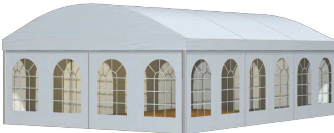
篷房俯视图与侧视图