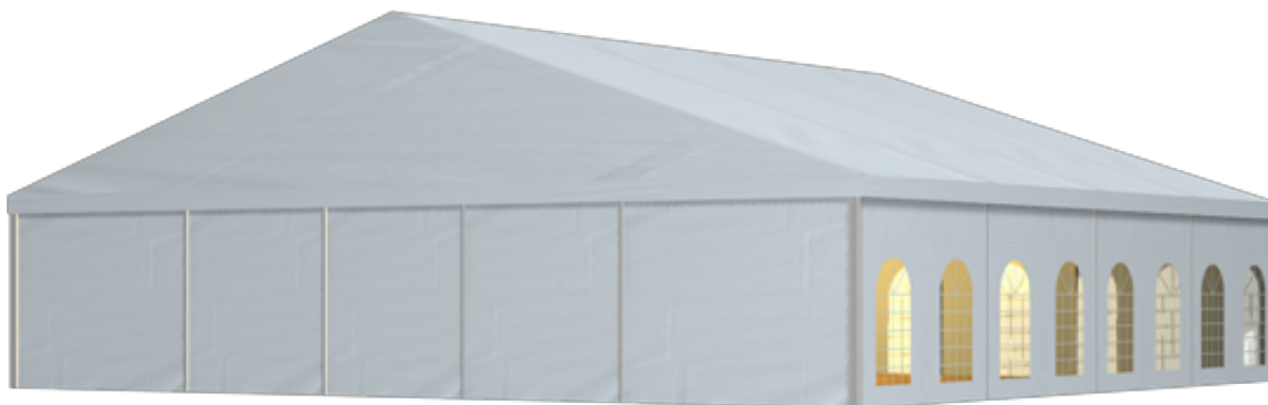
篷房俯视图与侧视图