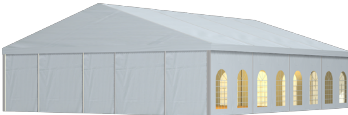
篷房俯视图与侧视图